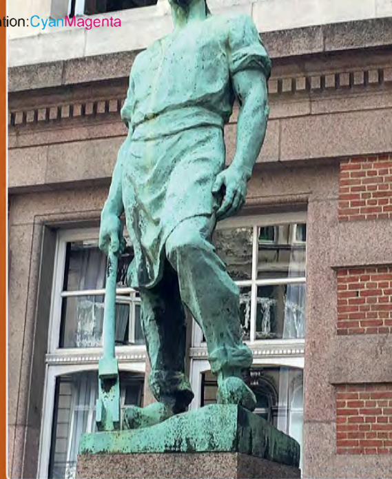
Arbeider (of Ovenman) 31