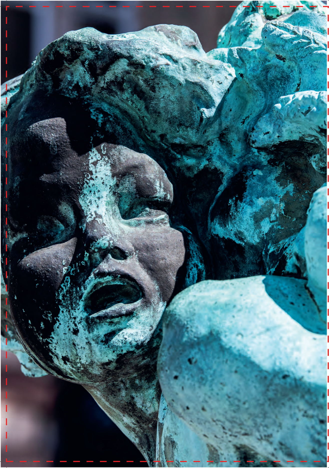
Travail:302833_TinkStudio_NL - Index des fiches:4 - Face:Arrière - Séparation:CyanMagentaYellowBlack