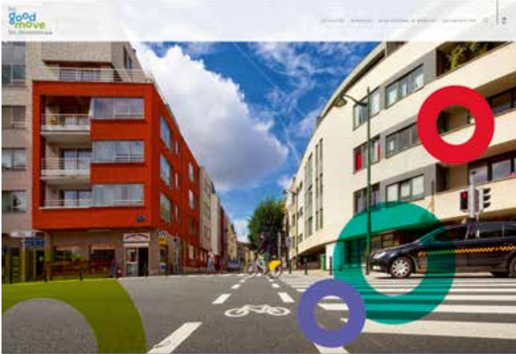
▲ Het gewestplan Good Move heeft gevolgen voor Sint-Gillis