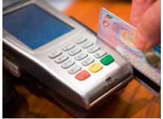
▲ Het CuBe