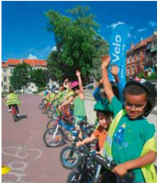
▲ Vélotheek, een zestigtal fietsen voor de scholen