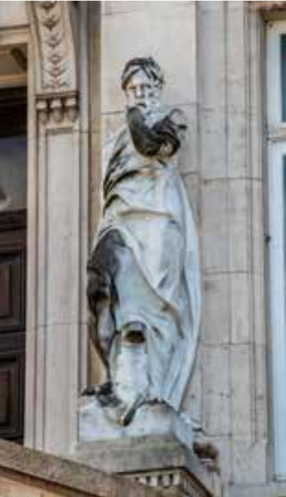
▲ Julien Dillens, Arbeid Verbazingwekkend beeldhouwwerk omdat arbeid zelden is afgebeeld door een samenwerking tussen handwerk (het aambeeld aan de voeten) en intellectueel werk (het peinzend gezicht). De oude man staat misschien symbool voor het levenseinde van de beeldhouwer, het was immers zijn laatste werk, een terugblik op zijn leven.

Het openbaar gezag beschermt. Het brengt kennis via onderwijs (9) en waakt over de volksgezondheid (3) en openbare veiligheid (4). Recht (10) en gerechtigheid (11) bepalen de koers van het gezag.