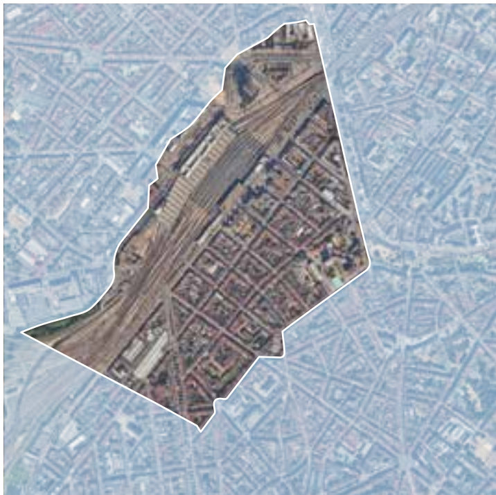
▲ De perimeter van het nieuwe wijkcontract

Ten slotte zal het wijkcontract ook zorgen voor een nuttige en harmonieuze aanvulling op de mid-delen die het gewest en andere operatoren inzetten.