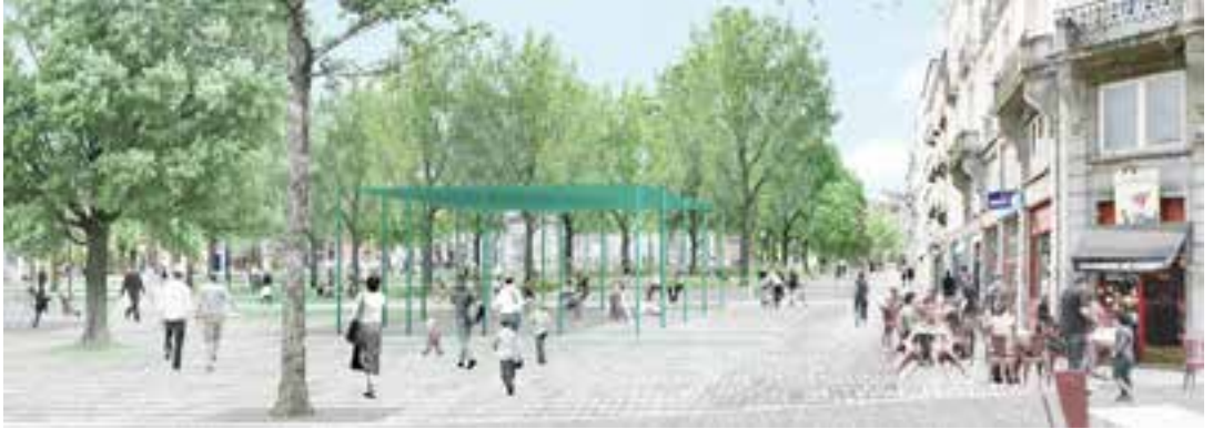
▲ Stadspark Marie Jansonplein