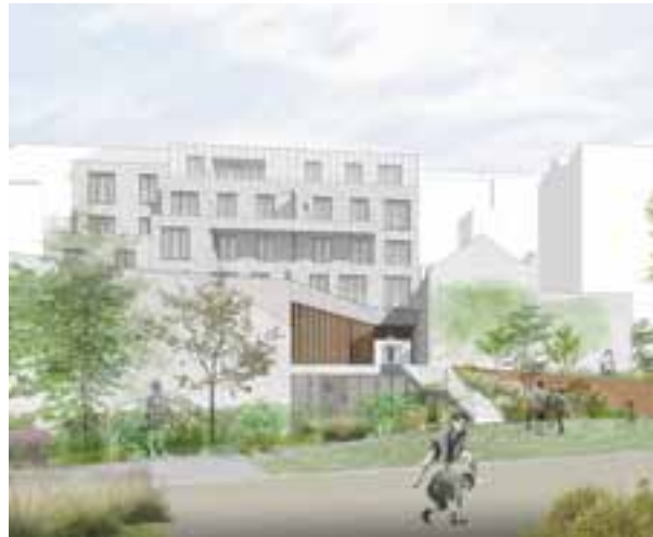
▲ Joséphine Mairesse Garden