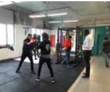
▲ Het CUBE