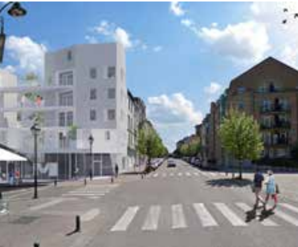
▲ Nieuwbouw op metro Horta