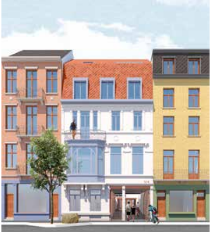
▲ De toekomstige voedingshal in de Théodore Verhaegenstraat ©V+

Een van de realisaties is de inrichting van een nieuwe ruimte rond het ouderschap op de Koningsslaan, die de gemeenten Sint-Gillis en Vorst samen met de vzw Le réseau saint-gillois des mini-crèches hebben ontwikkeld. Alle informatie over deze projecten van het SVC vind je in de brochure die beschikbaar is bij de Cel Stadsvernieuwing (aguyaut@stgilles.brussels).