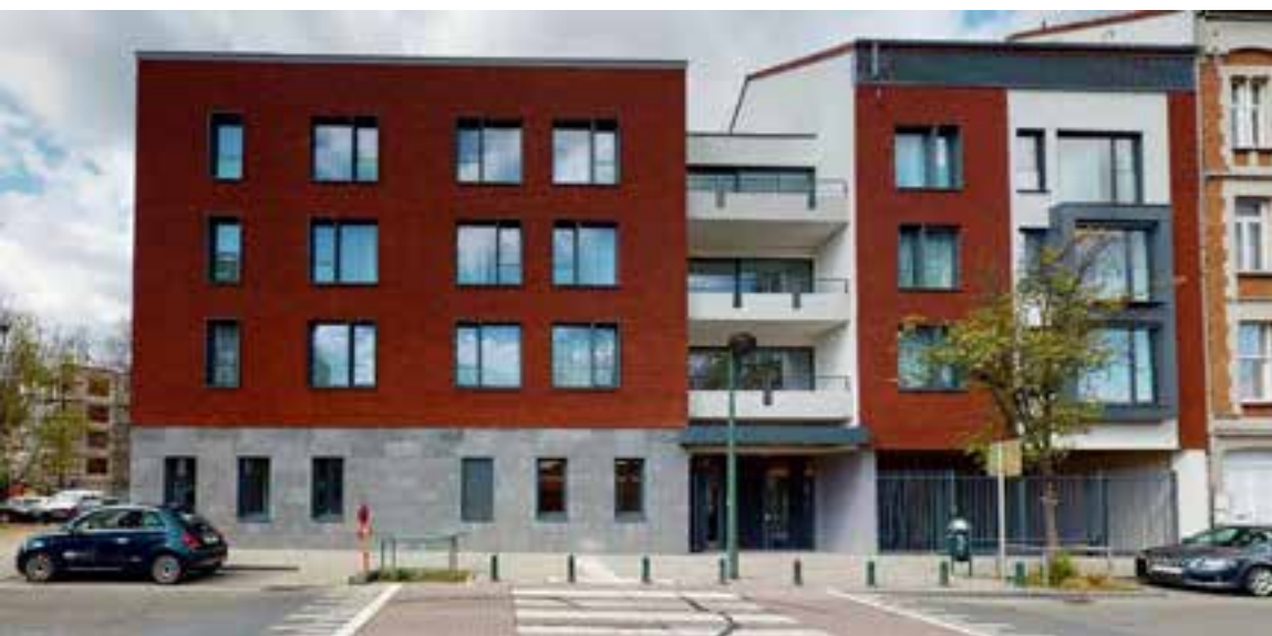
▲ Les Tilleuls

zal toenemen van 6 000 m 2 tot 13 000 m 2 .