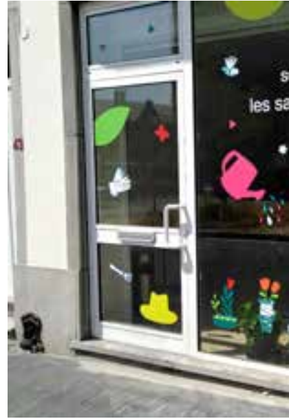
▲ De 'Saint-Gilliculteurs'