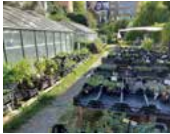
▲ La Pousse qui Pousse