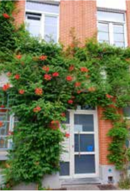
▲ Klimplanten op de gevels