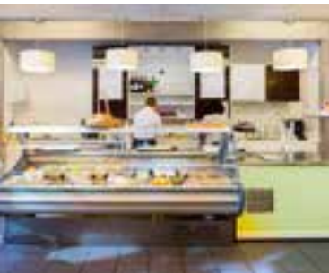
▲ De Ateliers du Midi