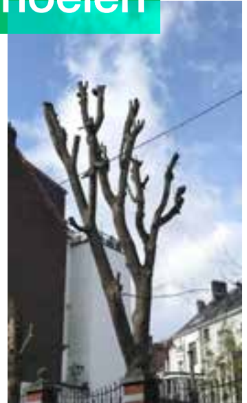
▲ ... en na

Helaas is ons bomenerfgoed in gevaar: de dienst Groene Ruimten van de gemeente stelt vast dat er steeds meer vraag is naar het snoeien en kappen van bomen in binnenhuizenblokken. De lockdowns van het afgelopen jaar zijn daar ongetwijfeld niet vreemd aan, aangezien mensen nu meer behoefte hebben aan zonlicht. Regelmatig krijgen bomen een te stevige snoeibeurt, waardoor ze de volgende jaren verdorren en uiteindelijk sterven. Om bomen te snoeien of om te hakken heb je een vergunning nodig. Artikel 98 van het Brussels Wetboek van Ruimtelijke Ordening bepaalt immers dat een vergunning nodig is voor "elke ingreep die de over-