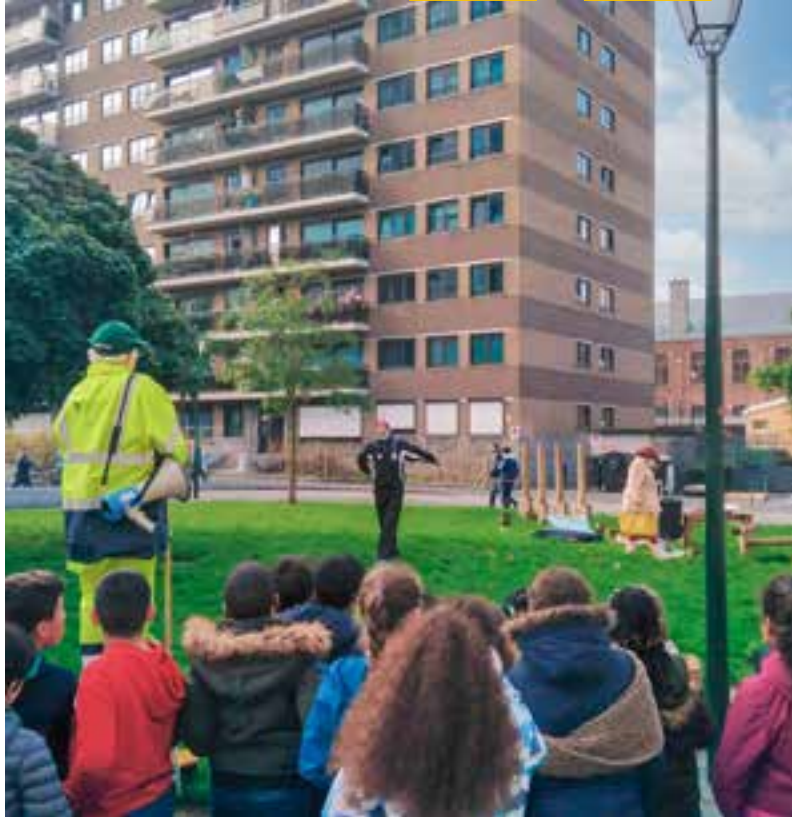
▲ Openbaar project "Netheid"