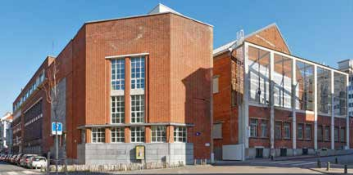
▲ De 'Pigeonnier'