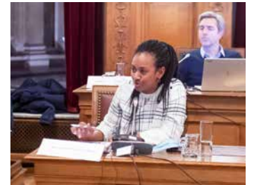
↑ De PBR op de gemeenteraad

te nemen aan het welslagen van collectieve projecten, te stimuleren. De gemeentelijke diensten en verenigingen dragen hun steentje bij door alle burgerinitiatieven te ondersteunen, te begeleiden en aan te moedigen. Hoe ver staan we intussen?