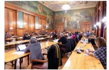
↑ Zitting van de gemeenteraad

twintig meerderjarigen, Belgen of buitenlanders. Alle informatie vind je op onze website www.stgillis.brussels onder Diensten/Politie.