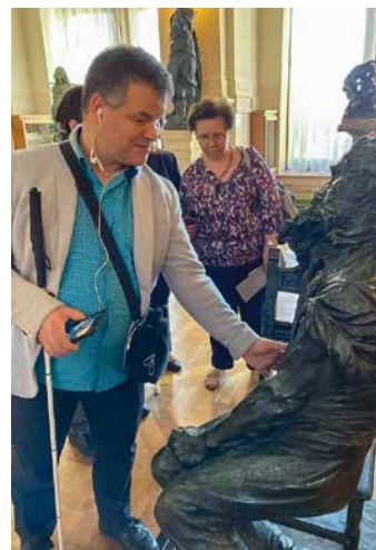
↑ De eerste inclusieve rondleiding door het stadhuis met een groep blinden en slechtzienden

Restauratrice Laure Mortiaux werkte in de Europazaal van het Stadhuis tien dagen lang aan de restauratie van een schilderij van Omer Dierickx. Talrijke bezoekers, waar-