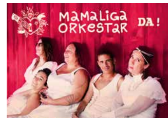
↑ Mamaliga Orkestar

Al twintig jaar lang is het Feest van de Muziek een must voor de inwoners van Sint-Gillis. Een mooie gelegenheid om muzikanten uit Sint-Gillis en uit de Federatie Wallonië-Brussel te promoten. Op het programma: Mamaliga Orkestar, S O R O R, Rumbaristas en Atheris.