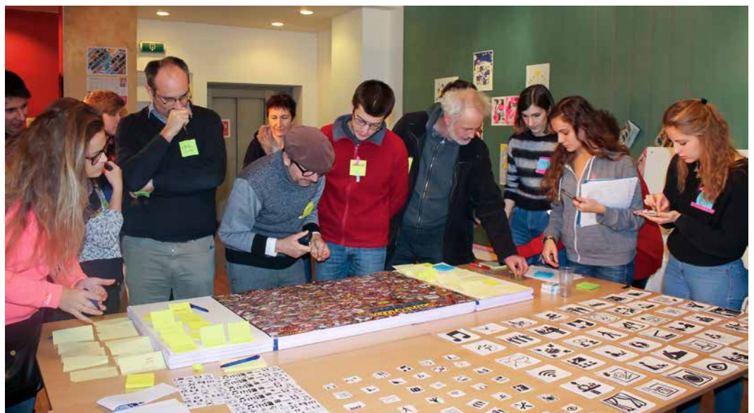
↑ Deelneming van de inwoners in de programma's van de wijkcontracten

Voor meer informatie kun je terecht op wijken1060.brussels .