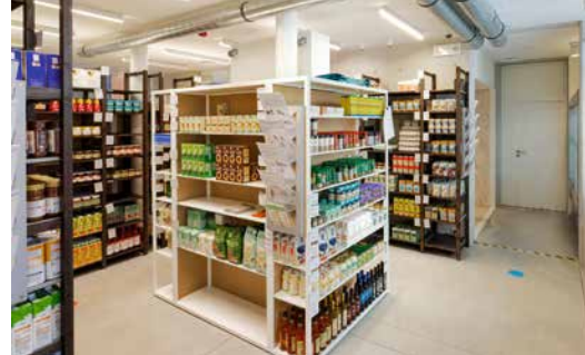
← Sociale kruidenierswinkel Epi Sint-Gillis

En dan is er nog de sociale kruidenierswinkel Epi Sint-Gillis . Die is opgezet binnen de Coördinatie van de Sociale Actie en heeft als belangrijkste taak basisproducten tegen verlaagde prijzen aan te bieden aan gezinnen met een beperkt budget. Epi Sint-Gillis streeft naar een grotere betrokkenheid van haar werknemers met een inschakelingscontract en van haar klanten, door laatstgenoemden