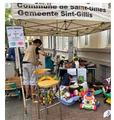
↑ Espace donnerie de la Recyclerie sociale

In de lokalen van de dienst Netheid in de Vorstsesteenweg 63 kun je terecht om je elektronisch afval (gebruikte gloeilampen, kleine huis-