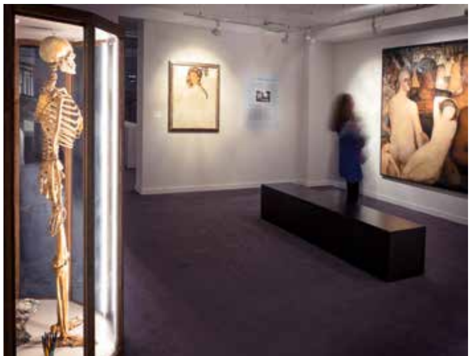
↑ Het Spitzner Museum, dat hij ontdekte op de Zuidfoor met zijn skeletten en andere anatomische elementen, was een rijke bron van inspiratie voor de schilder.