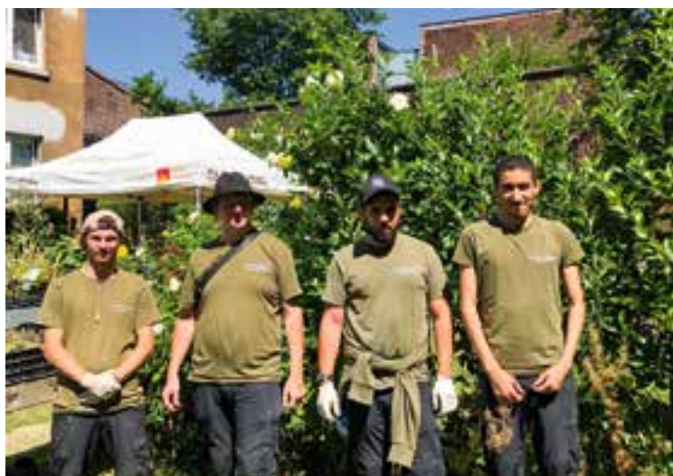
↑ Het Saintgilliculteurs team

Concreet steunt de Cel Stedelijk Groen projecten zoals de plaatsing van klimplanten aan gevels, beplanting van boomspiegels, aanleg van collectieve moestuinen... Tot op heden zijn er al 627 klimplanten gezet en tegen eind dit jaar komen er nog 22 bij, wat het totaal op bijna 650 brengt! Ongetwijfeld heb je in de gemeente al een van de Saintgilliculteurs ontmoet, de gemeentelijke medewerkers die verantwoordelijk zijn voor de aanplantingen van de CSG. Ze rijden rond met een elektrische bakfiets voor het vervoer van planten en al het materiaal dat nodig is voor de verfraaiing van de gemeente.