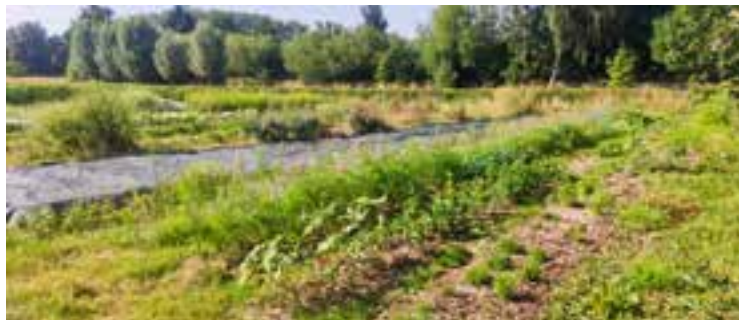
↑ Biologisch tuinieren in het kader van het Biotiful project

In dit kader zijn verschillende samenwerkingsverbanden opgezet, zoals met het project Saintgilliculteurs, waar momenteel drie art.60-medewerkers werkzaam zijn, en met de