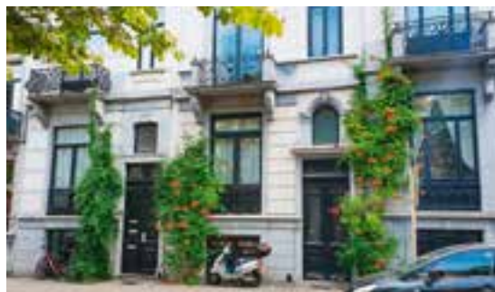
← Klimplanten aan gevels

zame ontwikkeling. De cel vormt een harmonieuze aanvulling op de taken van andere gemeentelijke diensten in de openbare ruimte zoals stedenbouw, openbare ruimte, groenzones, duurzame ontwikkeling,... Tegelijk legt ze haar oor te luister bij burgers en bewoners, die via initiatieven op vlak van vergroening, de kwaliteit van de openbare ruimte willen verbeteren.