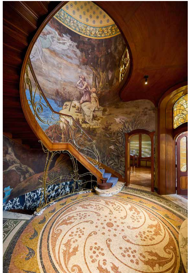
↑ De verschillende vertrekken schitteren rond de centrale hal, van waaruit de monumentale trap met een fresco van de Franse schilder Paul-Albert Baudouin vertrekt.

In 1983 werd het interieur geklasseerd. Nadat er huiszwam werd ontdekt, startten grootschalige renovatiewerken met het oog op het behoud en een modernisering van het pand. In 1988 bood het onderdak aan de fotografische ruimte Contretype. In 2014 stond het helaas leeg. Nieuwe restauratiewerken moesten de erg aangetaste fresco in het trappenhuis redden en de mozaïeken, de ramen en de serre herstellen. In 2022 werd op initiatief van de gemeente en het Brussels Gewest de vzw Maison Hannon opgericht om van het pand een museum te maken – samen met het Hortamuseum – en de restauratiewerken verder te zetten.