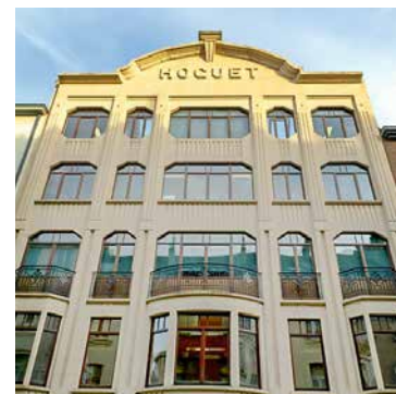
↑ De Franstalige gemeentebibliotheek, Romestraat.

“De gemeente Sint-Gillis zet haar klimaatbeleid verder via innoverende klimaatprojecten.”