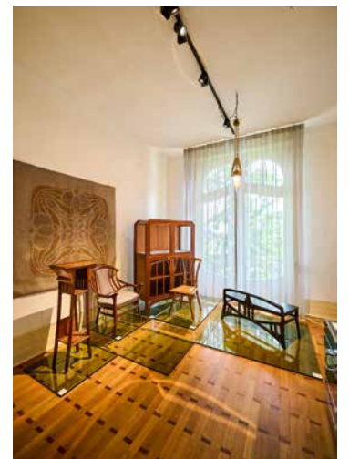
↑ Op de 1e verdieping vinden tijdelijke tentoonstellingen plaats. De eerste is gewijd aan de Belgische art nouveau met Paul Hankar, Henri Van de Velde en Gustave Serrurier-Bovy.