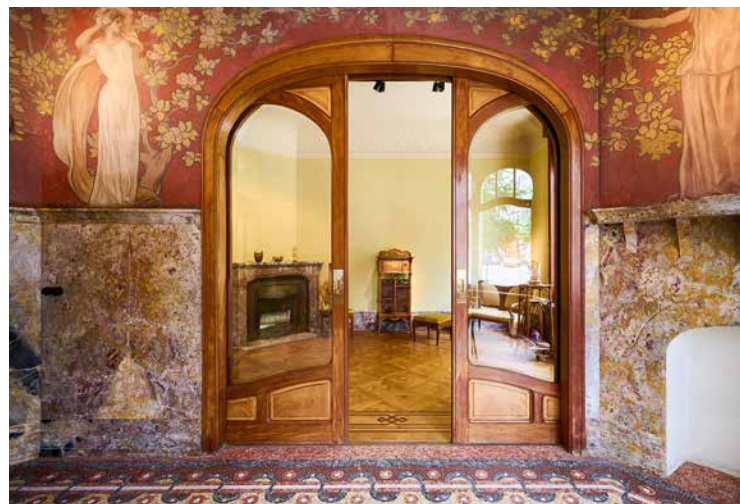
↑ Op het gelijkvloers van het huis Hannon is een ongeëvenaarde reconstructie van de historische locatie te zien die de originele staat benadert.