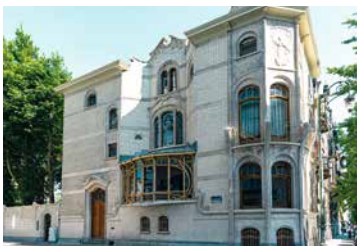
↑ De gevel sluit aan op de hoek, met bovenaan een bas-relief van Victor Rousseau rond het verglijden van de tijd.