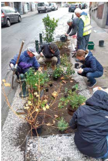
↑ Less béton more flowers

Na een architectuurwedstrijd werd het bureau Multiple gekozen om de heraanleg te realiseren. Het plein wordt op die manier weer een open, autovrije openbare ruimte, een plek om elkaar te ontmoeten, voor een markt, voor rust en spel. Net als op het Fernand Cocqplein, het Voorplein en het Kasteleinsplein zal de parking er binnenkort niet meer dan een anachronistisch relict zijn. De Demeurlaan wordt vergroend en er komt een autovrije zone in miniatur tussen de Dejaerlaan en de even genummerde kant van het plein. Het openbaar onderzoek zou in de herfst plaatsvinden.