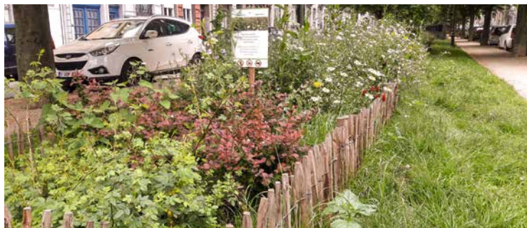
↑ Bloemenweiden Koningslaan

> sensibilisering en het gebruik van de fiets als verplaatsingsmiddel zijn voortdurend aangemoedigd, met name door de oprichting van twee velotheken: centra waar scholen fietsen kunnen lenen, aanmoediging van de scholen om met hun leerlingen deel te nemen aan de Vollenbike Challenge , die kinderen die met