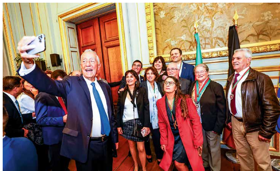
↑ De Portugese president bezoekt Sint-Gillis

Het meest memorabel moment was ongetwijfeld het bezoek van de president van de Portugese Republiek, Marcelo Rebelo de Sousa , op het stadhuis in oktober 2023, tot grote vreugde van de Portugese gemeenschap, die sterk aanwezig is in Sint-Gillis. ■