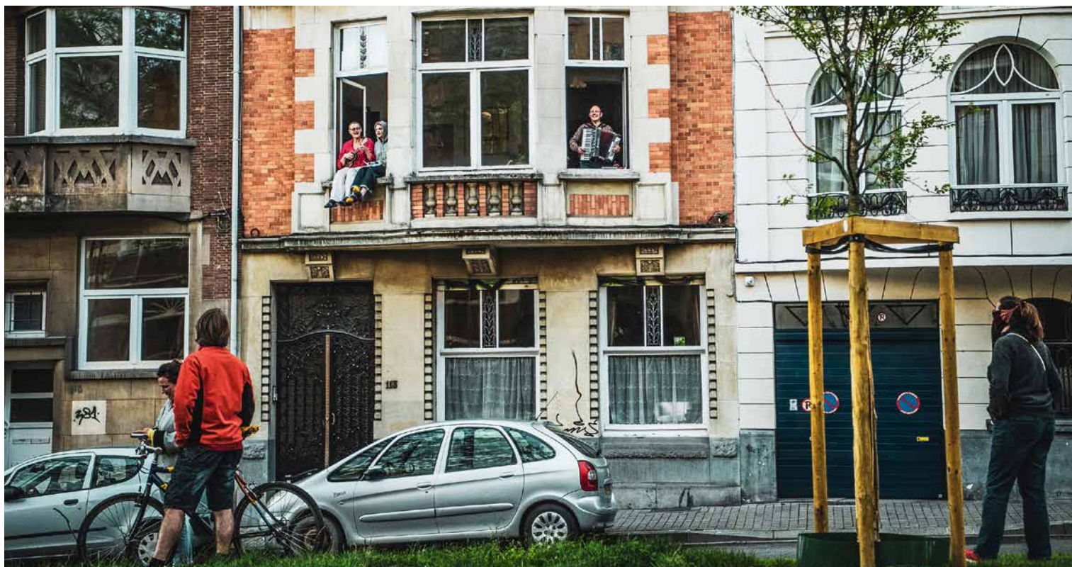
↑ In de tijd van covid-19

C risissen hebben hun stempel gedrukt op deze legislatuur en een enorme impact gehad op ons allemaal. Lockdown, stijgende energieprijzen door de oorlog in Oekraïne... en toch zijn we erin geslaagd de band tussen de gemeente en haar bewoners in stand te houden.