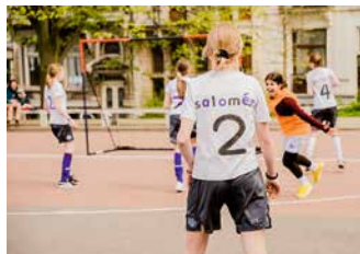
↑ "Place aux filles*"

De zichtbaarheid van vrouwen en minderheden is er tijdens deze legislatuur sterk op vooruitgegaan. Er is zoveel verwezenlijkt dat we het bij een kleine selectie moeten houden: