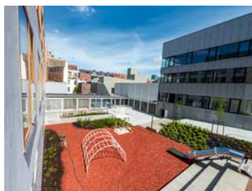
↑ Het ECAM

Cultuur is op elke leeftijd van belang. Daarom is er nu twee keer per jaar een