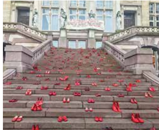
↑ "Red shoes"