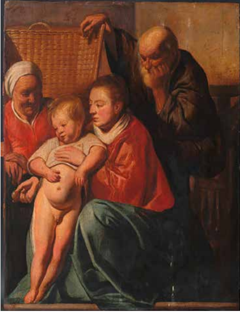
↑ De Heilige Familie van Jacob Jordaens