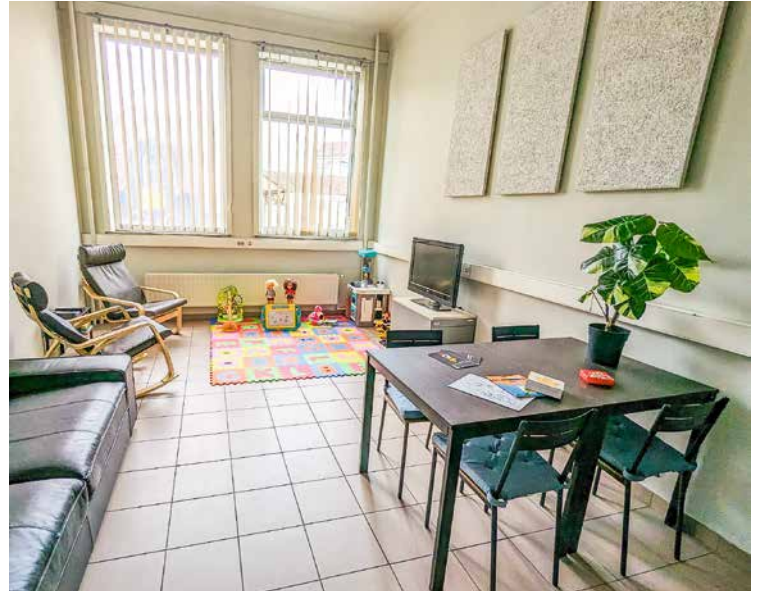
↑ De EVA-cel

De cel Schoolverzuim, die jongeren begeleidt in hun schoolcarrière (3.765 leerlingen begeleid tussen 2019 en 2023), is ondergebracht in de lokalen van het departement Jeugd.