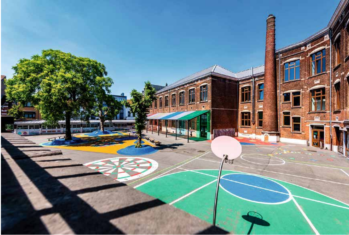
↑ Léonie La Fontaine-school