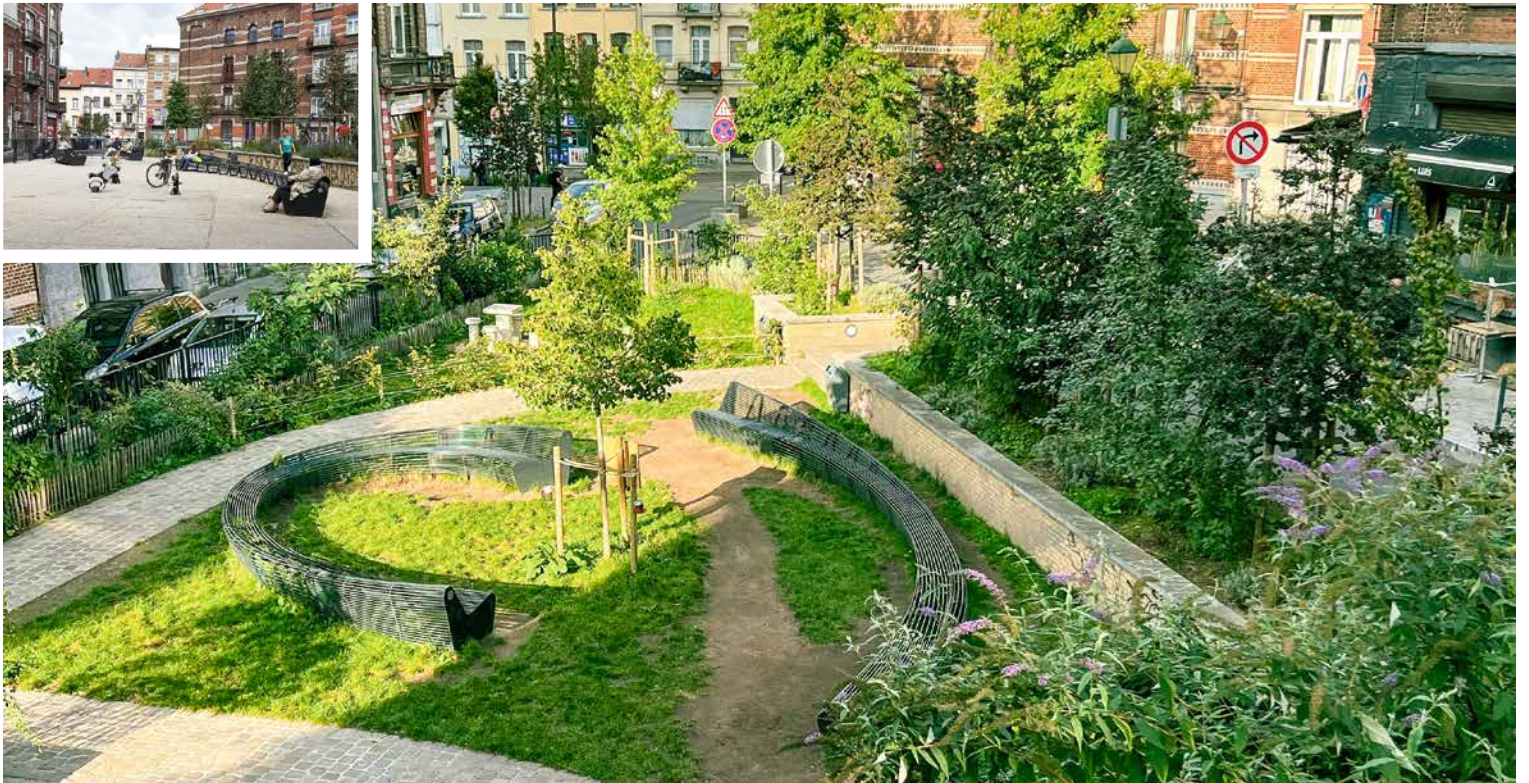
↑ Het "tweebankenplein" voor / na...