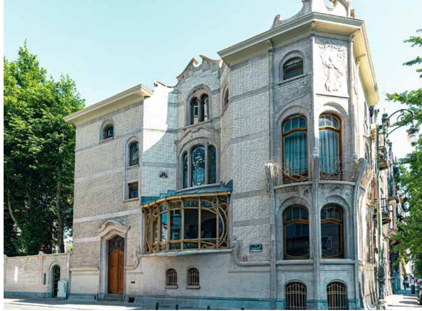
↑ Het Huis Hannon

Er zijn in de periode 2018-2024 veel initiatieven rond erfgoed geweest, zoals de start van het werk rond collecties (inventarisatie van kunstwerken), deelname aan de Open Monumentendagen, de introductie van kosteloze rondleidingen in het gemeentehuis voor inwoners van Sint-Gillis en de