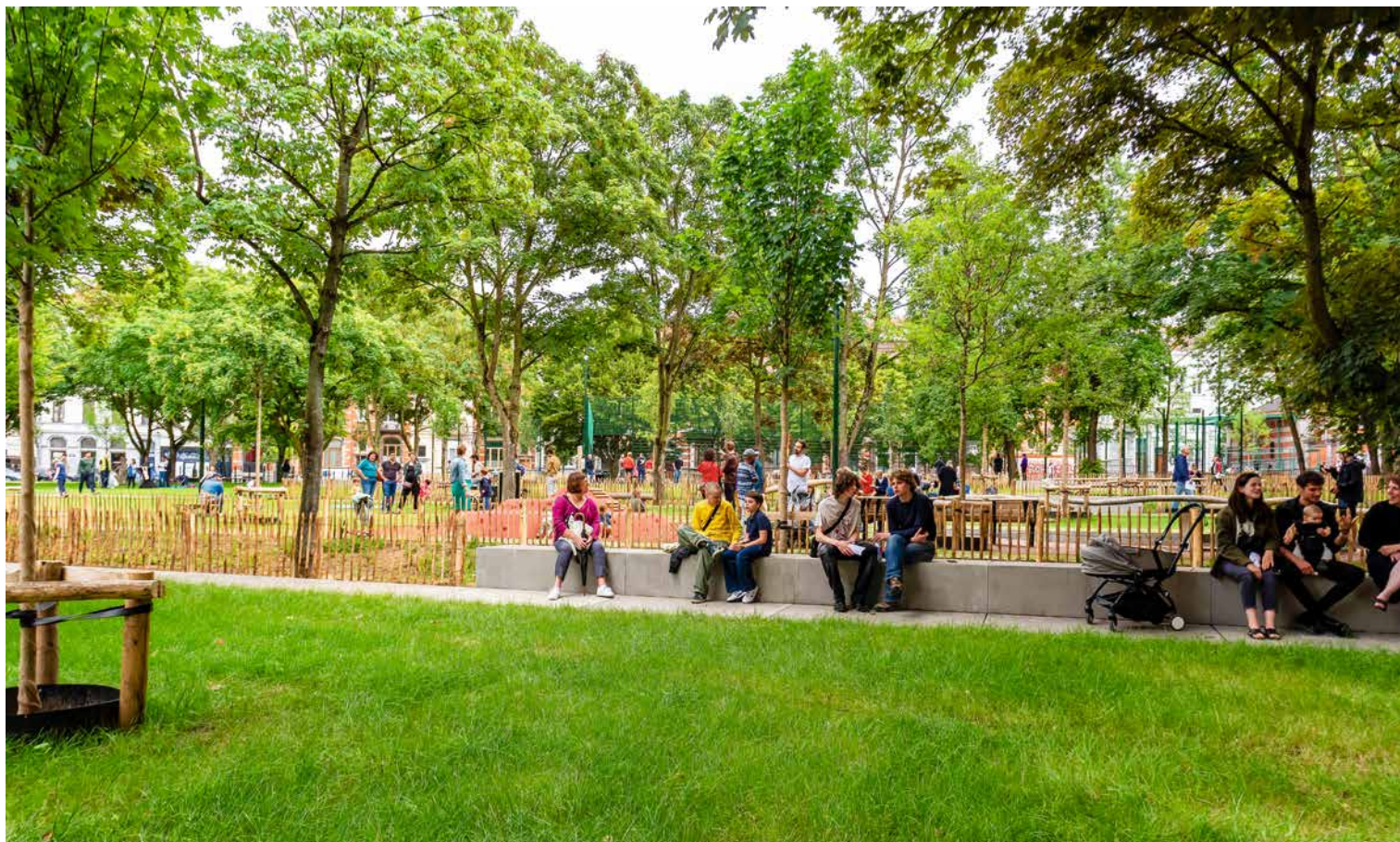
↑ Het Marie Jansonplein

Het Marie Jansonplein is een vlaggenschipproject van de legislatuur en van het duurzaam wijkcontract Voorplein-Morichar, ingehuldigd in juli 2023. Dit nieuwe stadspark is een echte groene long voor ons geliefd Voorplein. De herinrichting ervan bewijst dat de herwaardering en restauratie van het centrum van Sint-Gillis doorgaat. Het omvat nu nieuwe vrijetijds- en sportinfrastructuur (tafeltennis, oefenterrein, gerenoveerd sportveld), een stadspark (57 nieuwe bomen, een hondenspark, een openbaar toilet, 2 drinkwaterfonteinen, 4 beplantingszones), voorzieningen voor gezinnen (3 grote picknicktafels, 13 nieuwe banken) en voor kinderen (een waterpartij, 7 speelplekken). Ook telt het nieuwe plein 93 fietsbeugels en 1 afgesloten fietsenstalling met 22 plaatsen.