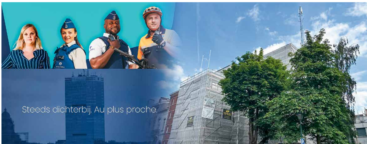
↑ Het Bréart commissariaat wordt volledig gerenoveerd

Veiligheid en preventie zijn twee luiken die de afgelopen jaren bijzonder veel van onze inspanningen gevraagd hebben. Eens te meer is een intensievere samenwerking tussen de verschillende overheidsniveaus en tussen de actoren op het terrein noodzakelijk geweest om doeltreffend te kunnen optreden tegen overlast en criminaliteit.