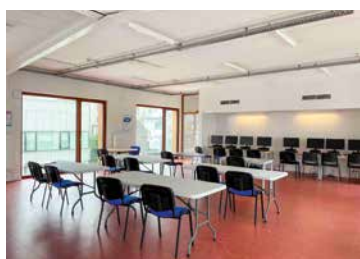
↑ De Scholatek

Ook hier zijn grote investeringen gedaan bij het OCMW, bij de Iris-Zuid ziekenhuizen en bij de politiezone. Die concretiseren onze engagementen op de gevoeligste gebieden. Er is grondig gewerkt om de studenten uit Sint-Gillis te ondersteunen door hen financieel te begeleiden (via het OCMW) en ook door in het ECAM te starten met Scholatek, zodat ze in de best mogelijke omstandigheden kunnen studeren.