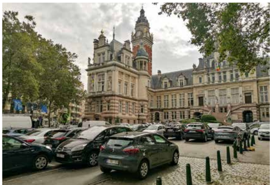
↑ Van Meenenplein voor / na...