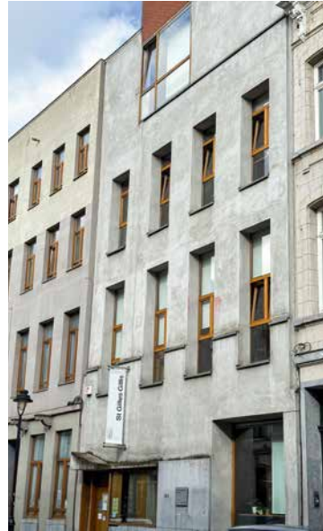
↑ Het nieuwe Preventiehuis

Meer bepaald heeft het CUBE (Centrum voor Stedelijke Expressie, ontwikkeld sinds 2021 in het kader van het Stadsbeleid en gesubsidieerd door het Brussels Hoofdstedelijk Gewest) er een muziekruimte, een sportruimte en een vrij toegankelijke foyer die gratis is voor elk lid, evenals thema- en/of sportworkshops.