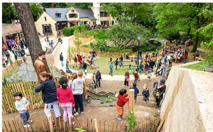
↑ Inhoudiging van het Pierre Pauluspark

Ook het Pierre Pauluspark werd onlangs opgeknapt als onderdeel van hetzelfde wijkcontract: er werden 16 nieuwe bomen geplant en de rotstuinen, oude ruïnes, de vijver en het romantische bruggetje werden gerestaureerd. We moeten ook de restauratie vermelden van wat oorspronkelijk de Engelse tuin van het Huis Pelgrims was en vooral de plaatsing van de grootste glijbaan in Sint-Gillis, in de nieuwe speeltuin die eveneens is uitgerust met houten modules en schommels.