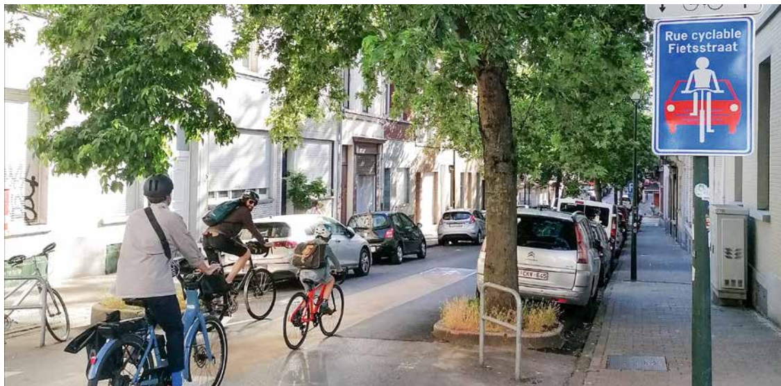
↑ Fietsstraten, fietsers hebben voorrang

Dat is de doelstelling van het Lokaal Mobiliteitscontract (LMC), het resultaat van een grondige analyse van de problemen die alle inwoners van Sint-Gillis op het vlak van mobiliteit en levenskwaliteit ondervinden. Na een studie- en raadplegingsfase heeft de gemeente een eerste voorstel voor