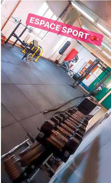
↑ Het CuBe