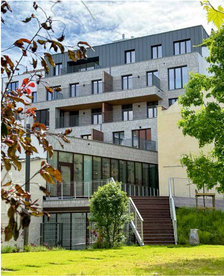
↑ Citydev verwierf koopwoningen

Het OCMW is eveneens actief op dit gebied en heeft in de Zwedenstraat een gebouw verworven dat volledig gerenoveerd zal worden om betaalbare kwaliteitswoningen aan te bieden, inclusief accommodatie voor grote gezinnen.